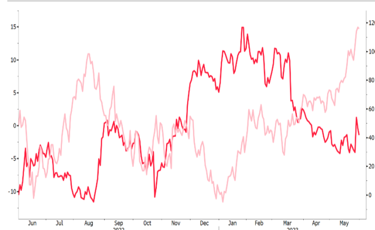
■ PDD US ■ NASDAQ INDEX

ปัจจุบันราคาหุ้นอยู่ที่ราคา $65.32 หากเทียบกับดัชนี NASDAQ Index ถือว่า Underperform โดยทาง Bloomberg Consensus เผยนักวิเคราะห์ 54 รายจากทั้งหมด 57 รายยังคงแนะนำ BUY โดยที่ให้ราคาเป้าหมายอยู่ที่ $107.05 ซึ่งมี Upside อยู่ที่ +63.9%