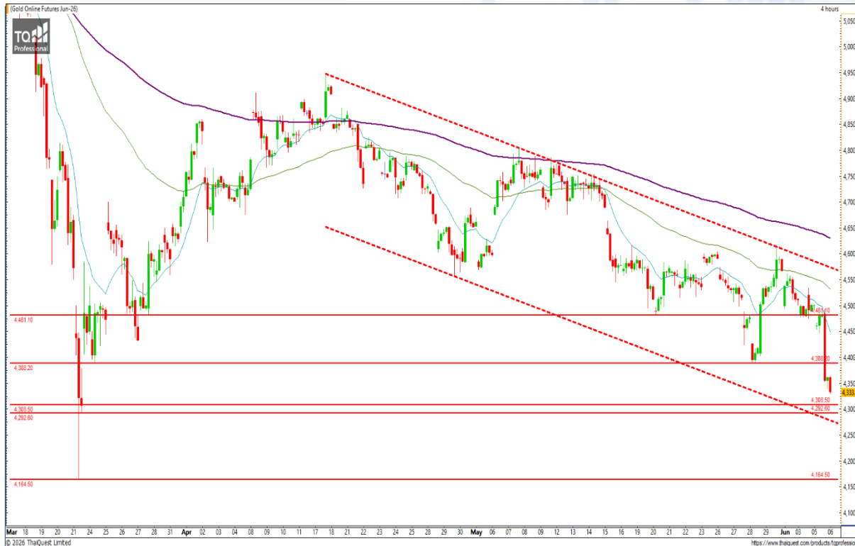
CHART INSIGHT Gold Futures