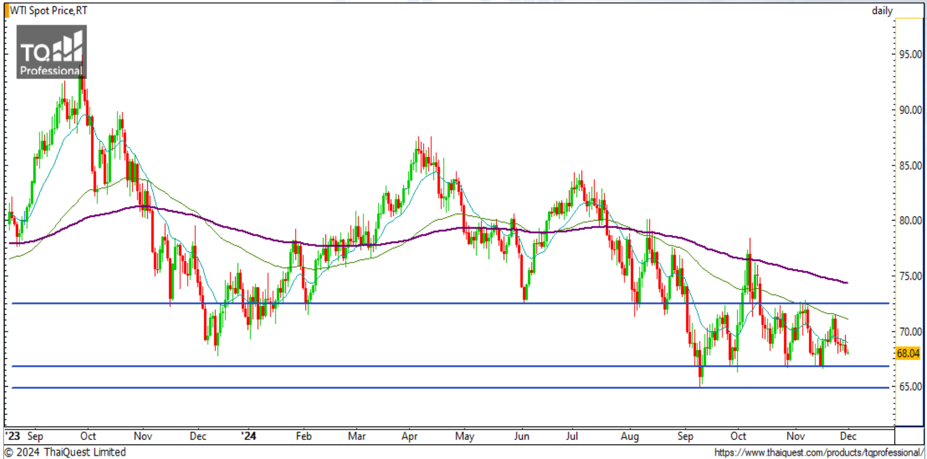
CHART INSIGHT Commodity Market