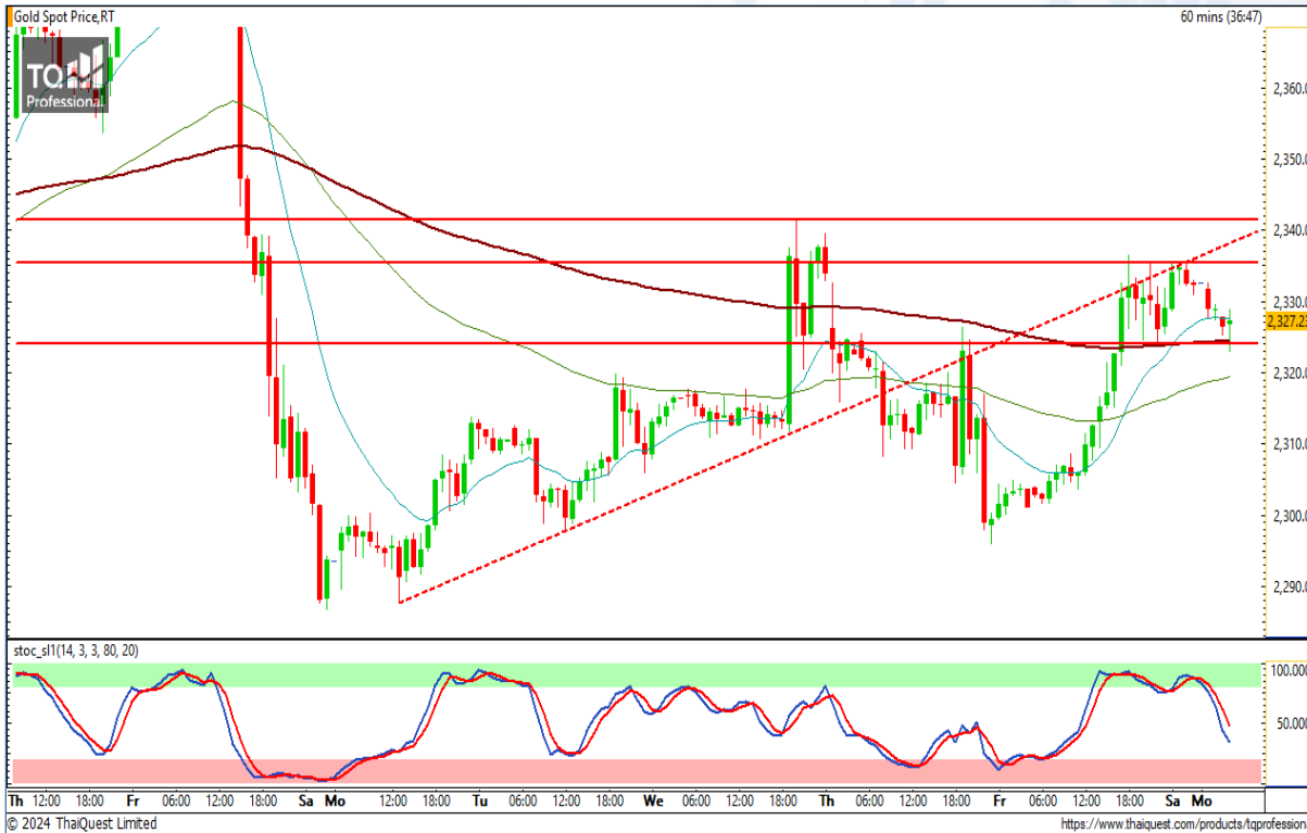
CHART INSIGHT | Gold Futures