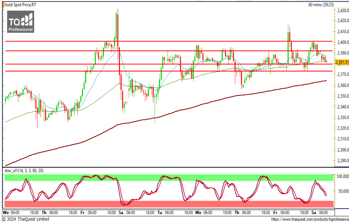
CHART INSIGHT | Gold Futures