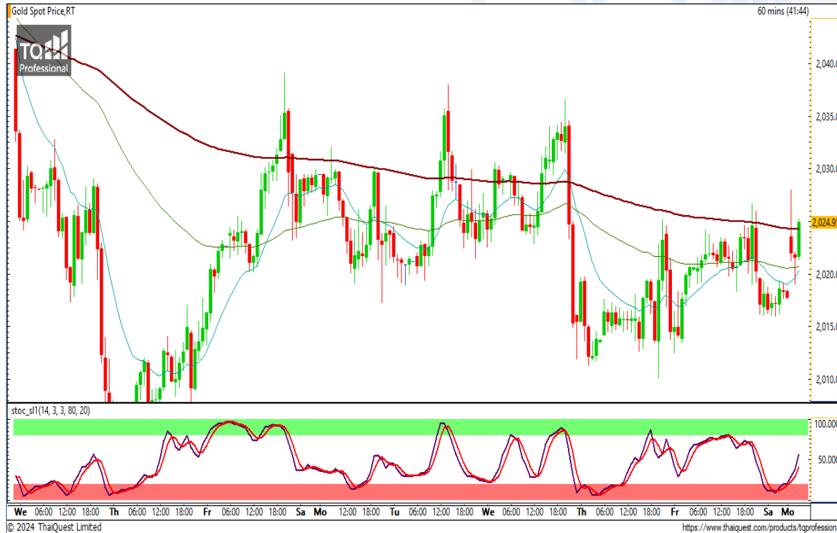
CHART INSIGHT | Gold Futures