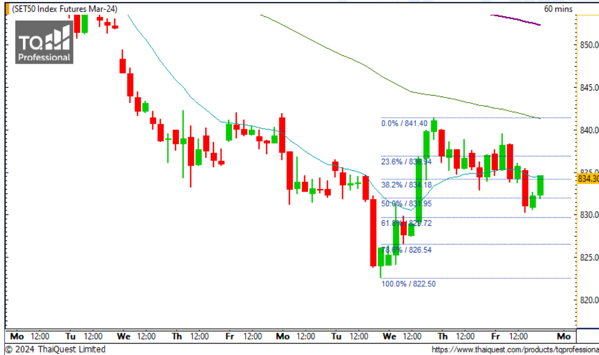
CHART INSIGHT SET50 Index Futures