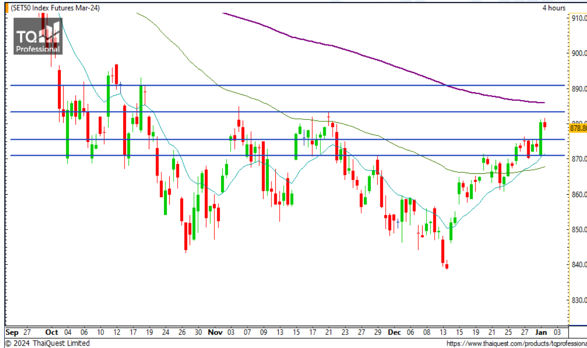
CHART INSIGHT SET50 Index Futures