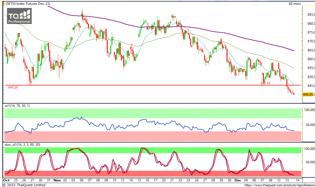
CHART INSIGHT SET50 Index Futures