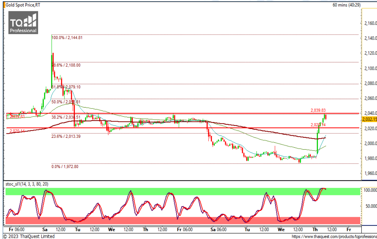
CHART INSIGHT | Gold Futures