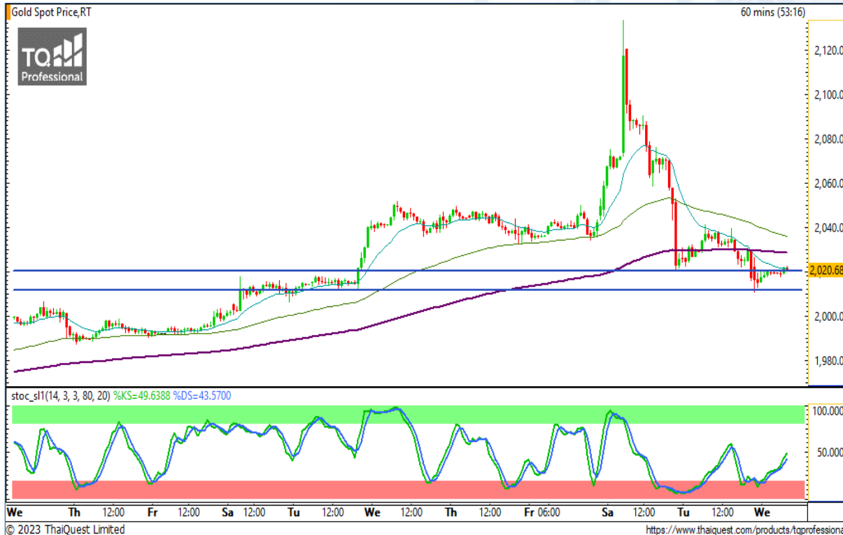
CHART INSIGHT | Gold Futures