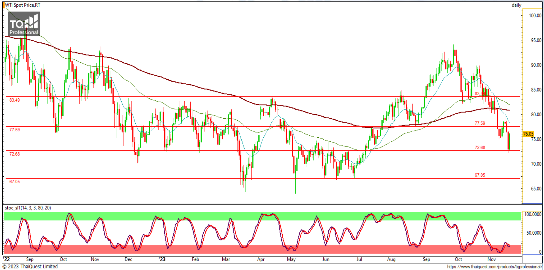
CHART INSIGHT Commodity Market