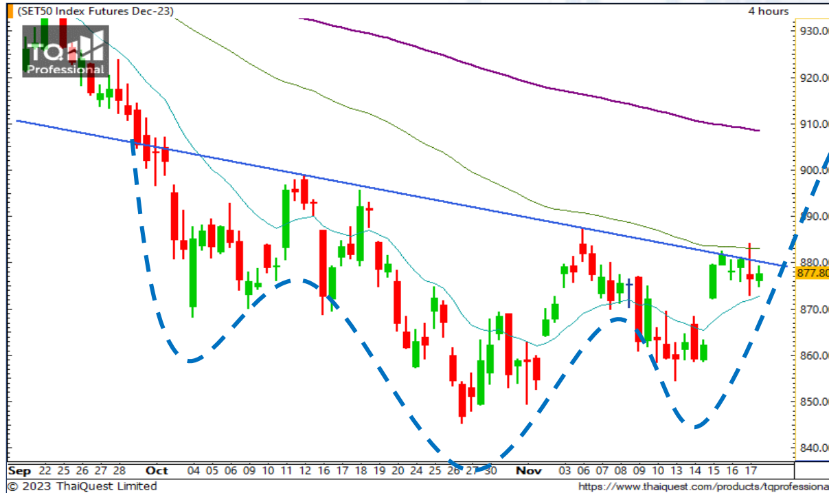
CHART INSIGHT SET50 Index Futures