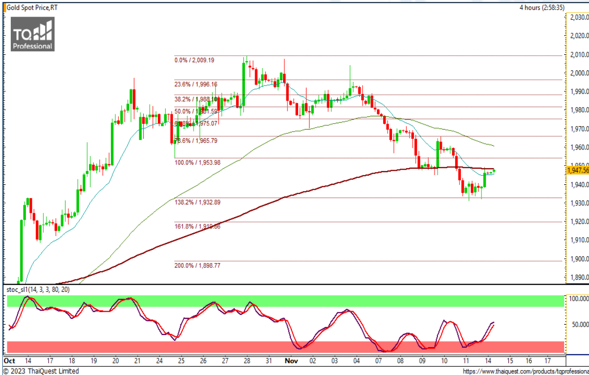
CHART INSIGHT | Gold Futures