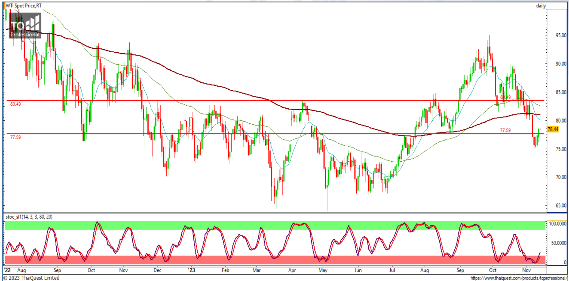
CHART INSIGHT Commodity Market