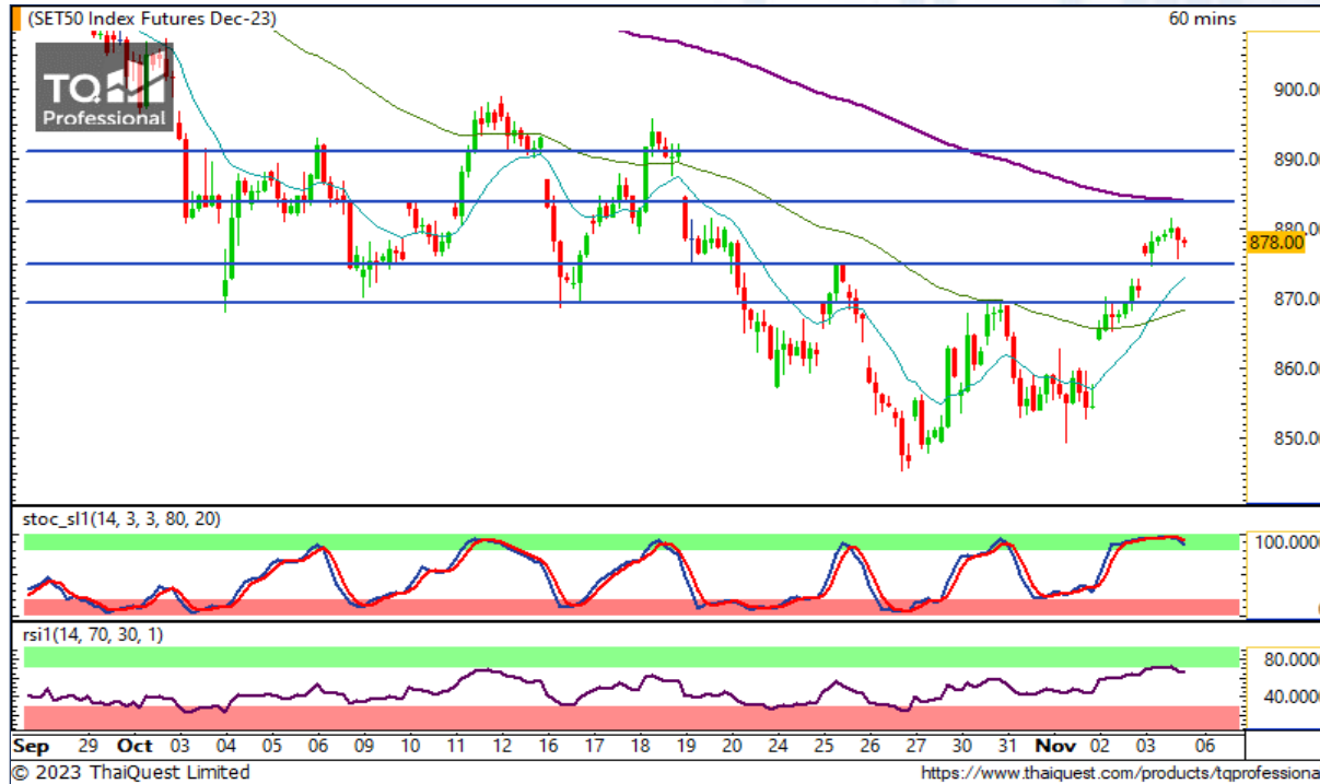
CHART INSIGHT SET50 Index Futures