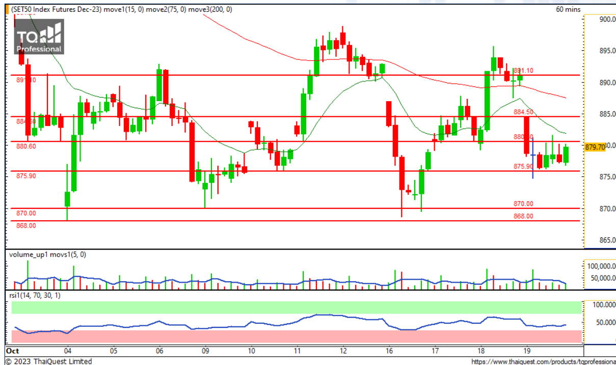
CHART INSIGHT SET50 Index Futures