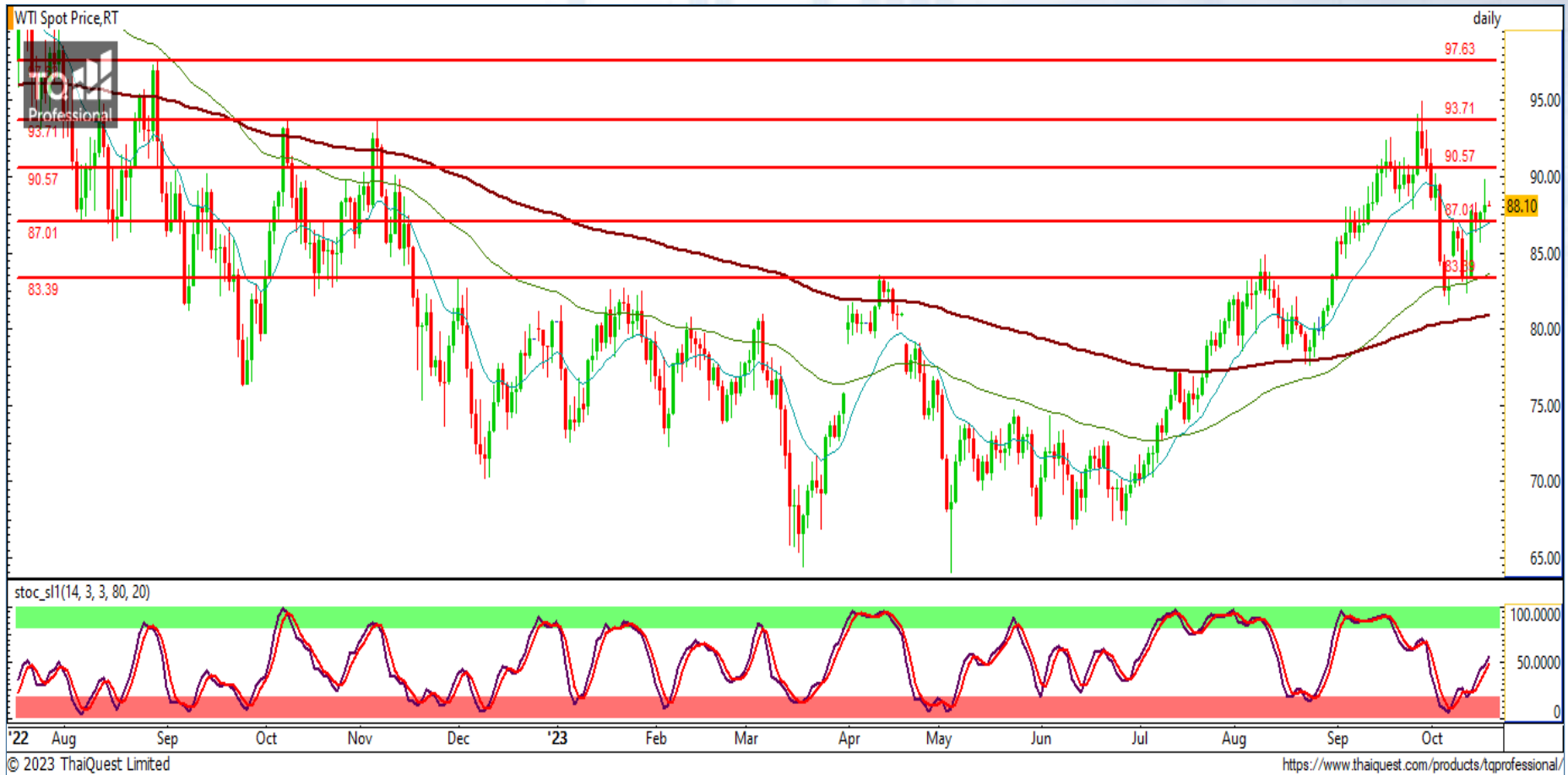
CHART INSIGHT Commodity Market