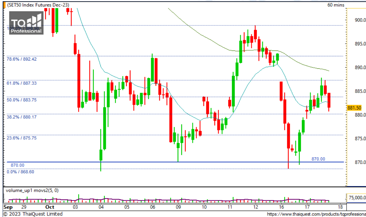
CHART INSIGHT SET50 Index Futures