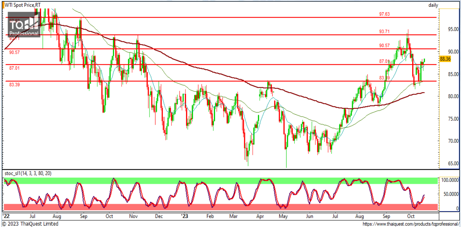
CHART INSIGHT Commodity Market