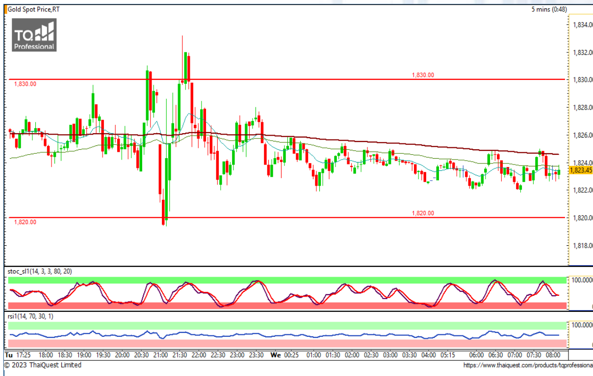
CHART INSIGHT Gold Futures