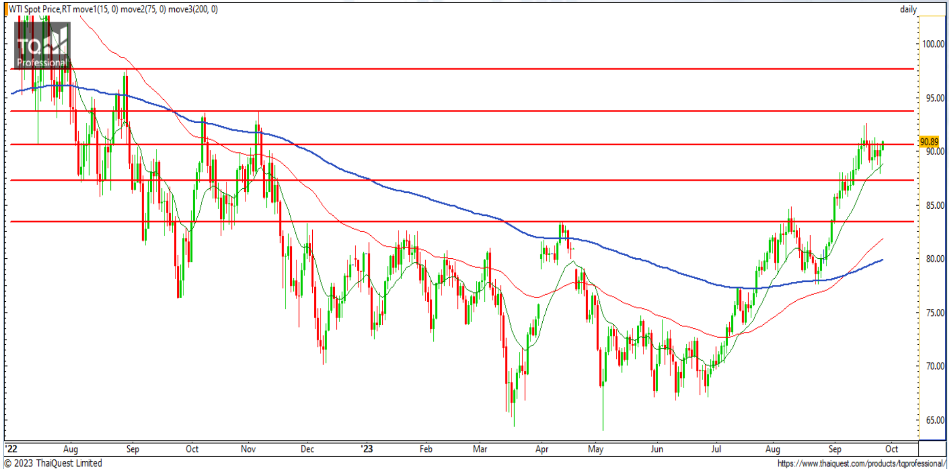
CHART INSIGHT Commodity Market