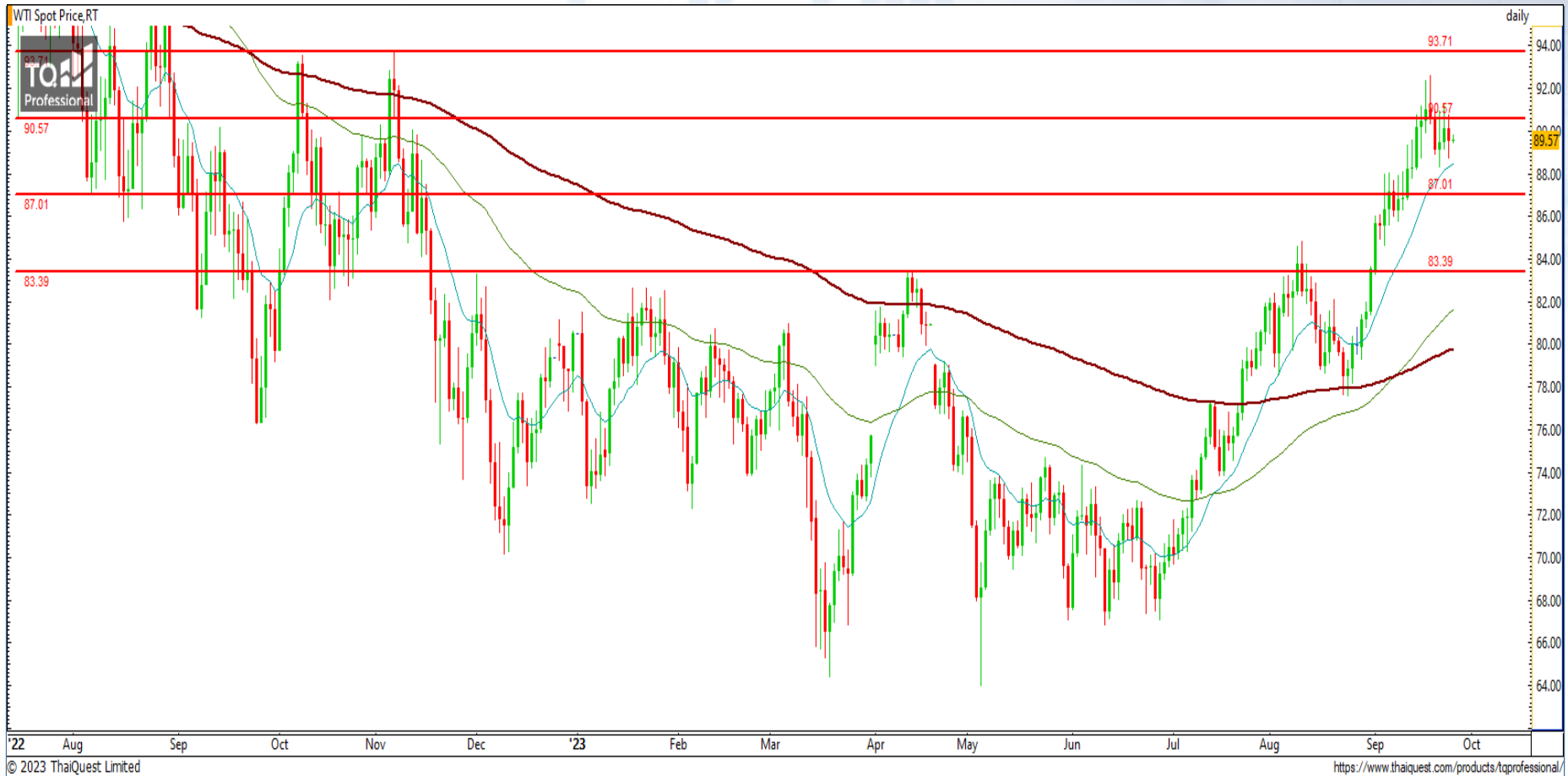
CHART INSIGHT Commodity Market