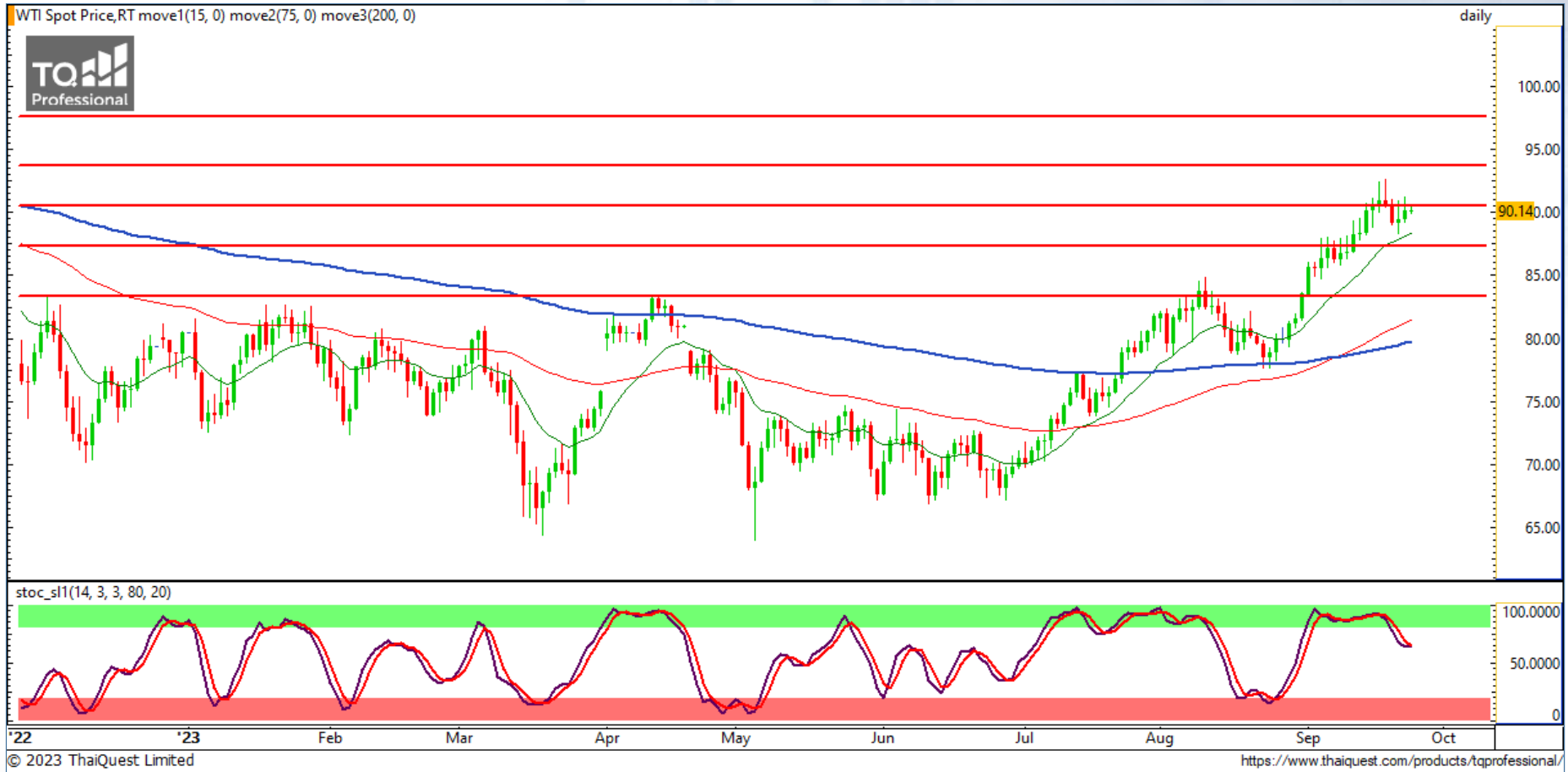
CHART INSIGHT Commodity Market