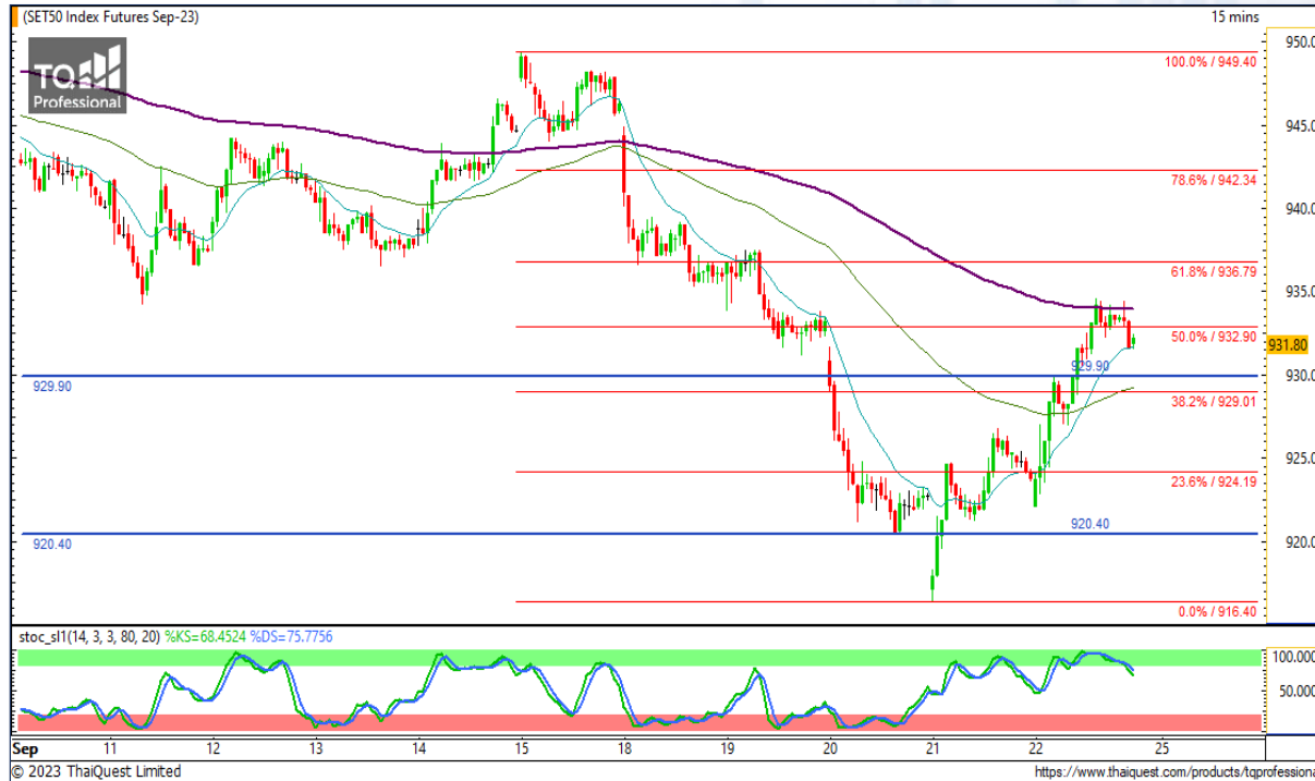
CHART INSIGHT SET50 Index Futures