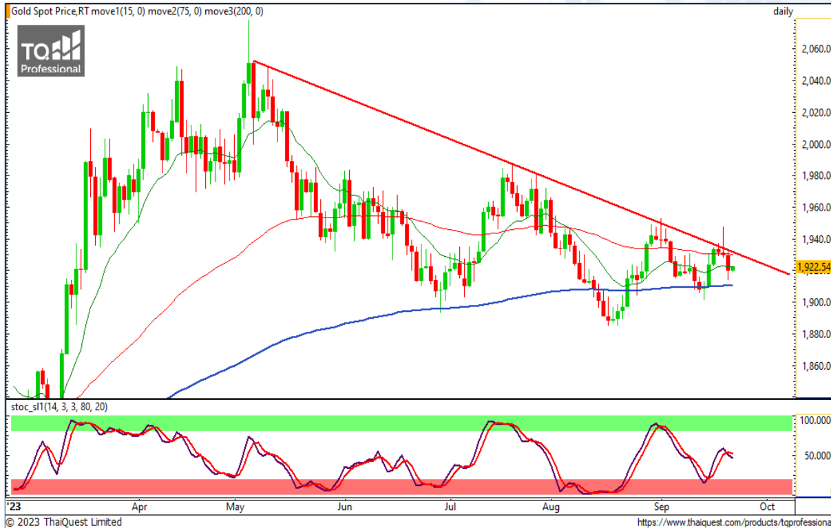
CHART INSIGHT | Gold Futures