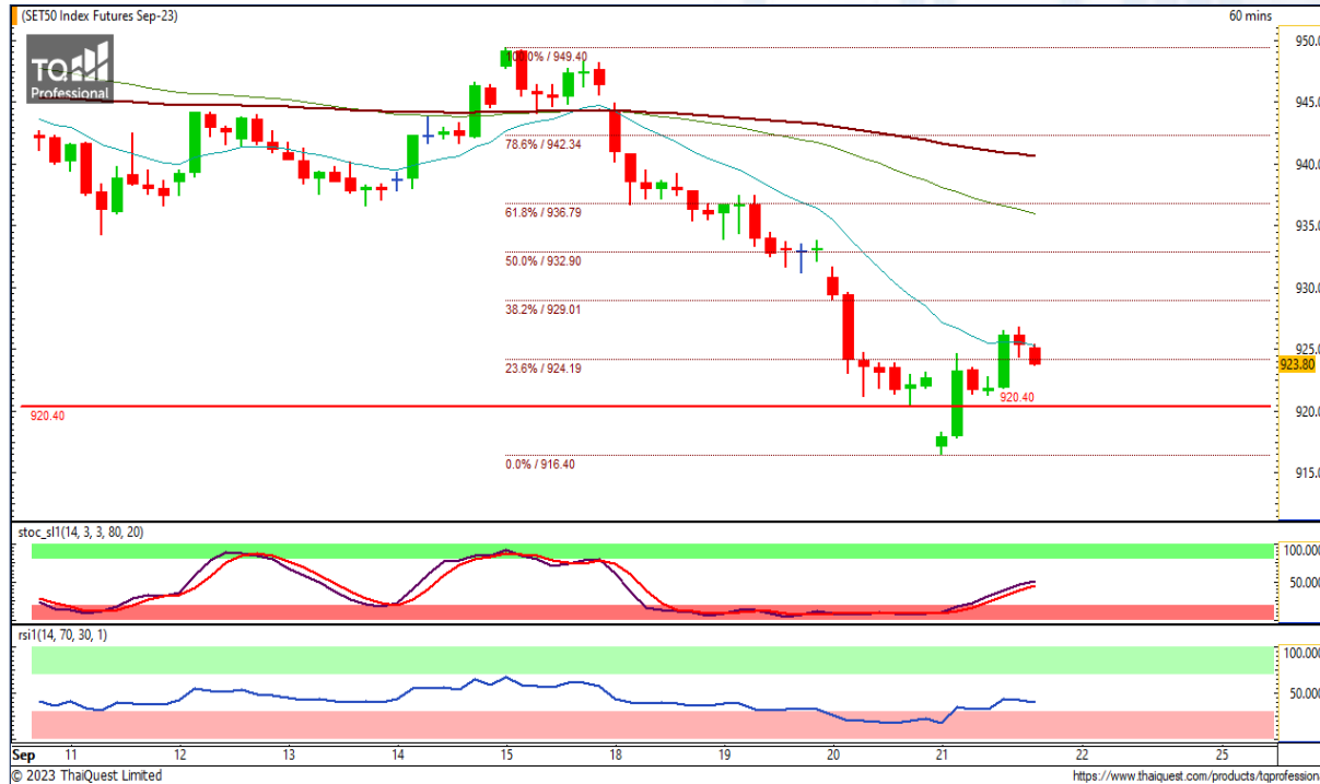
CHART INSIGHT SET50 Index Futures