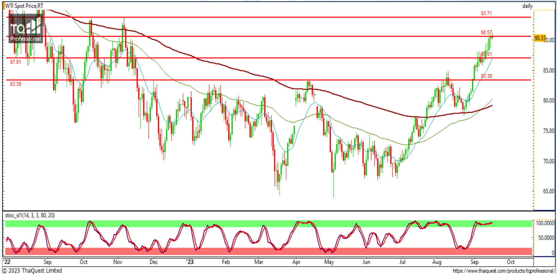
CHART INSIGHT Commodity Market