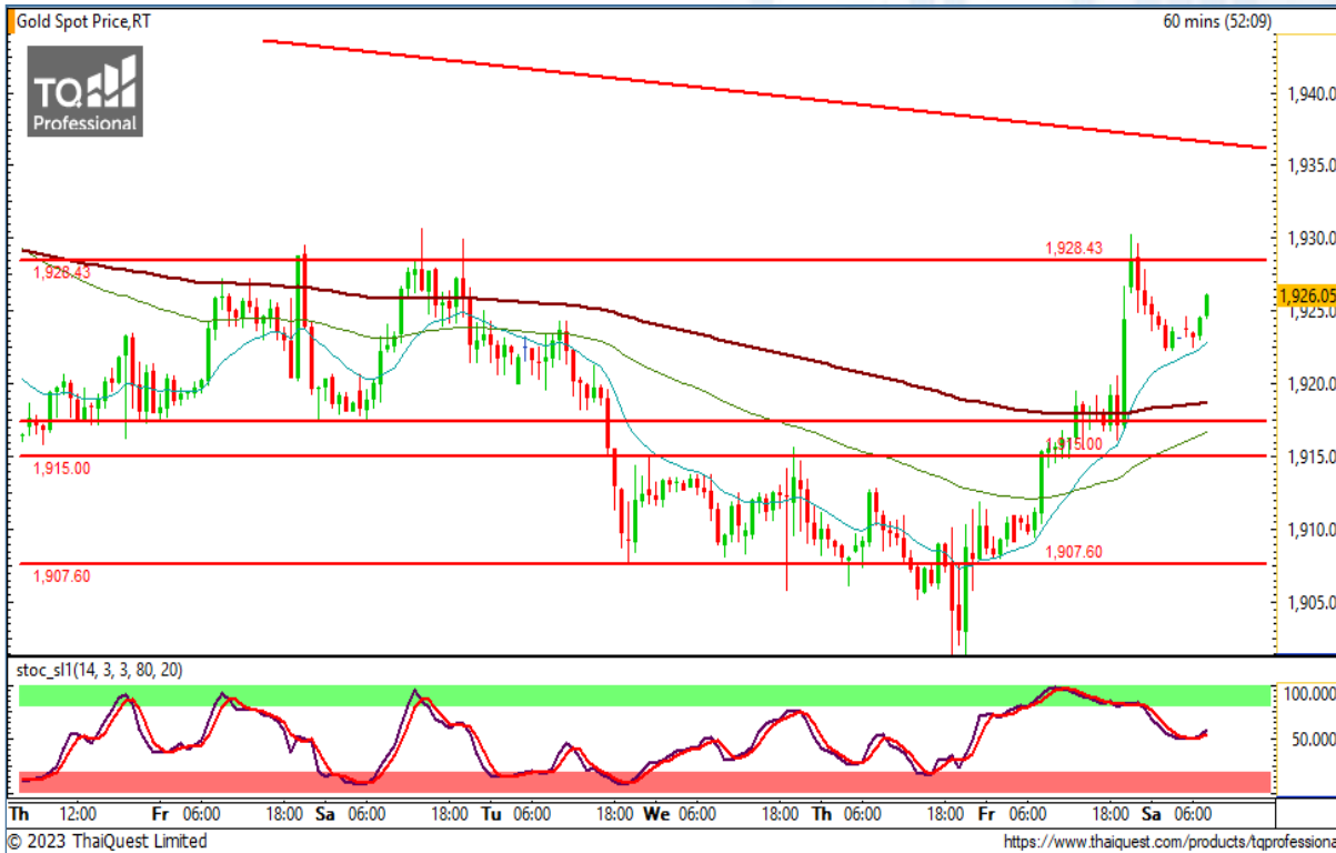
CHART INSIGHT | Gold Futures