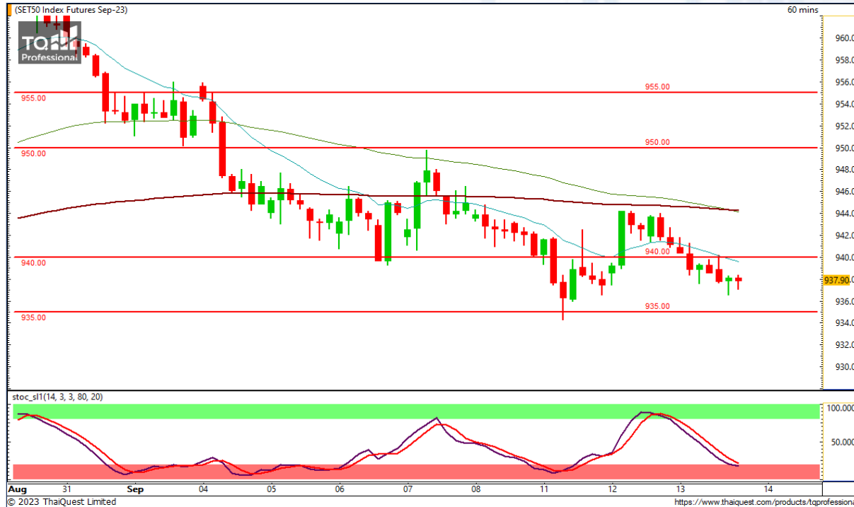
CHART INSIGHT SET50 Index Futures