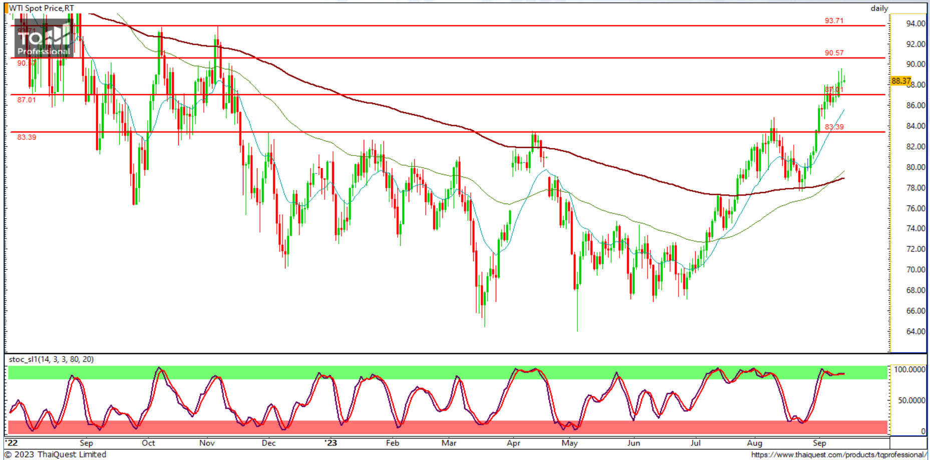
CHART INSIGHT Commodity Market