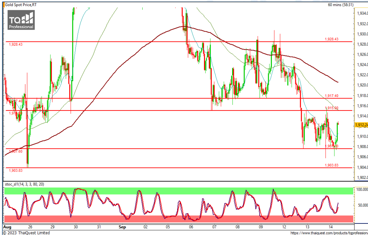
CHART INSIGHT | Gold Futures