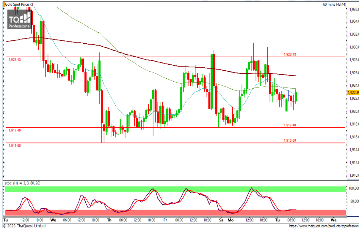
CHART INSIGHT | Gold Futures