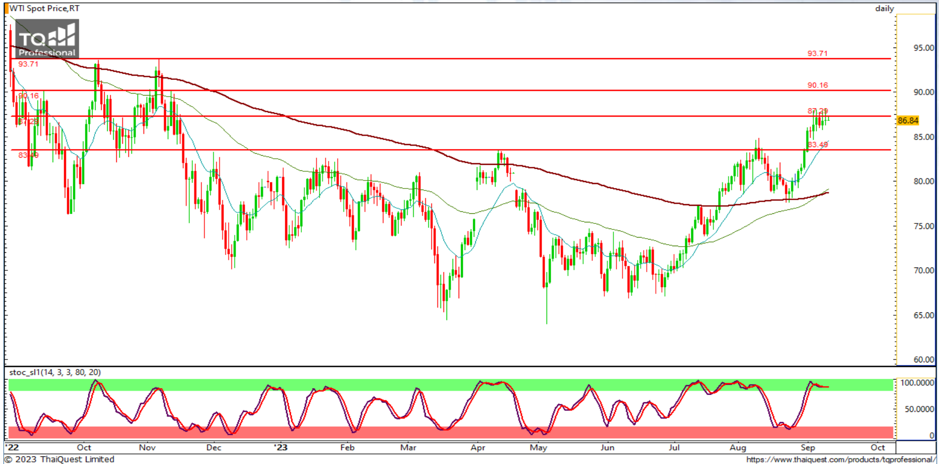
CHART INSIGHT Commodity Market