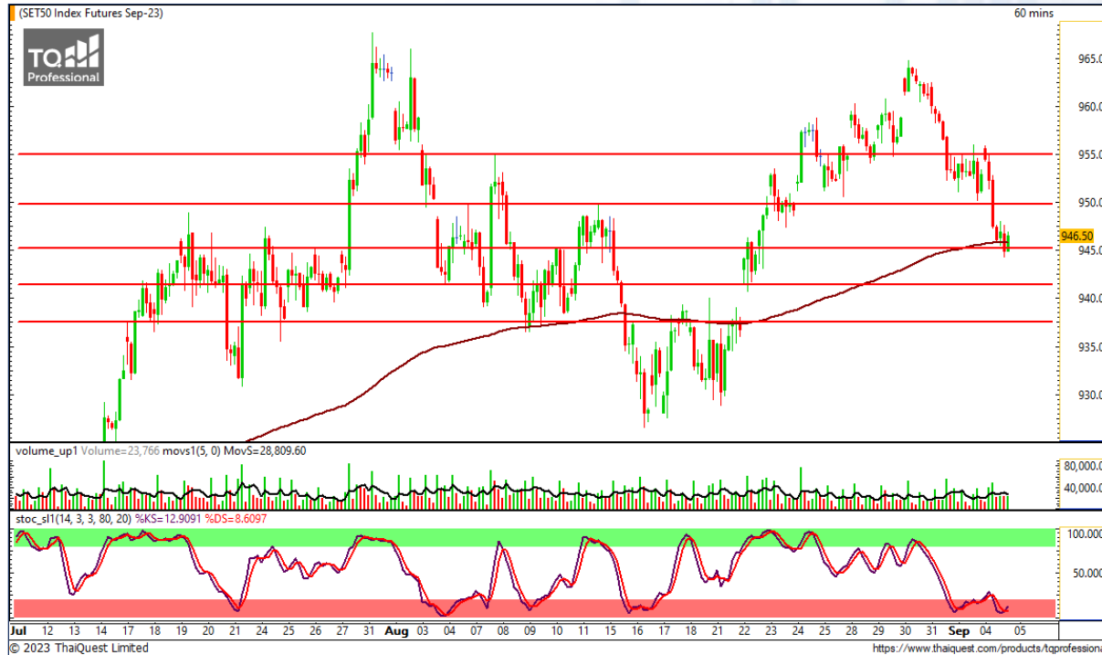
CHART INSIGHT SET50 Index Futures