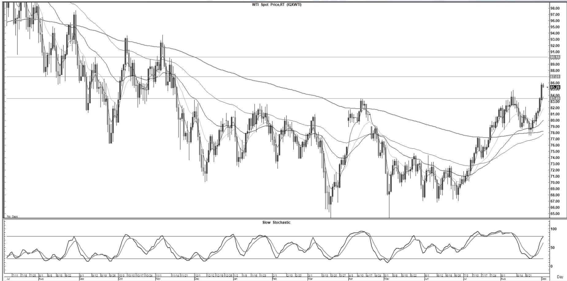
CHART INSIGHT Commodity Market