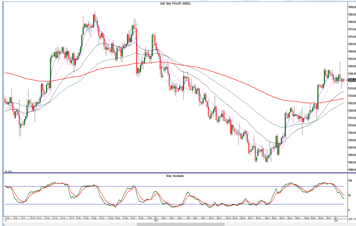
CHART INSIGHT | Gold Futures