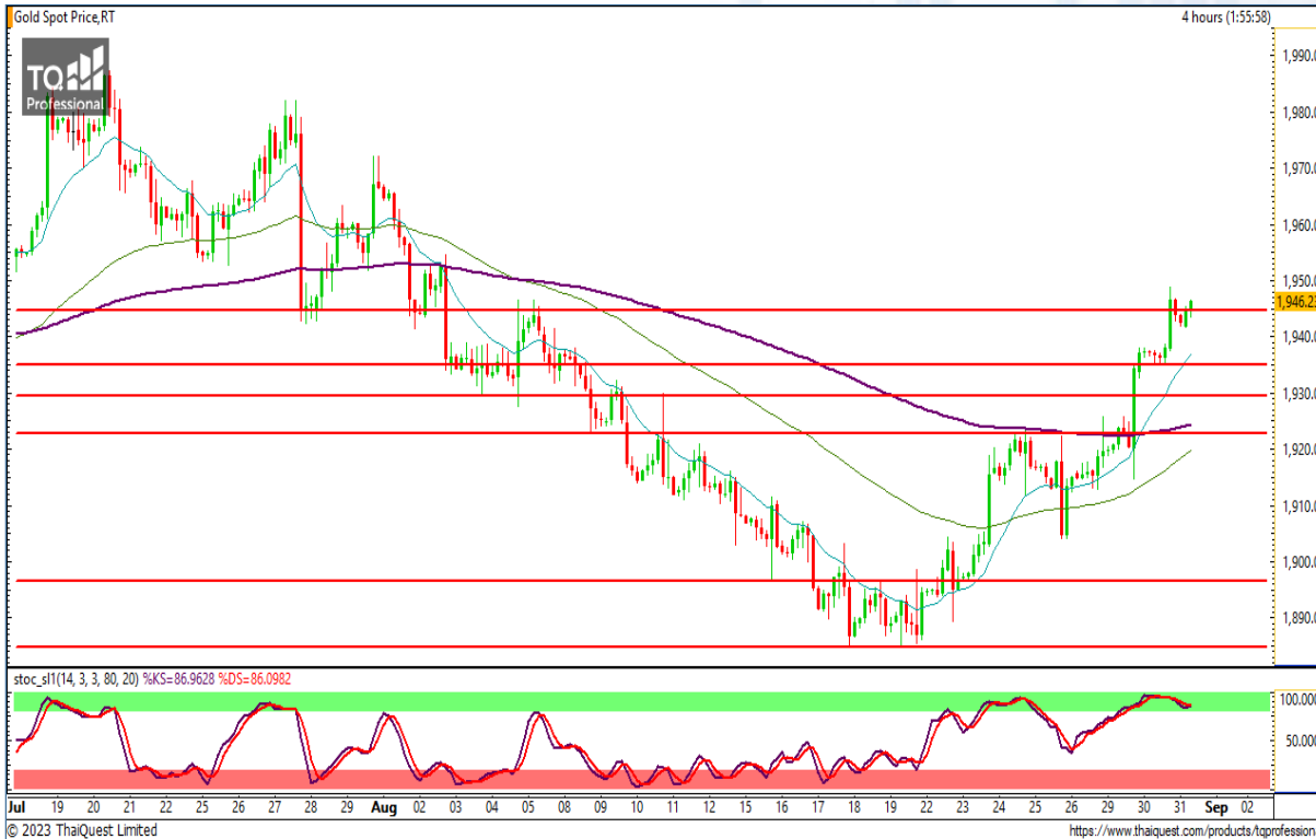
CHART INSIGHT | Gold Futures