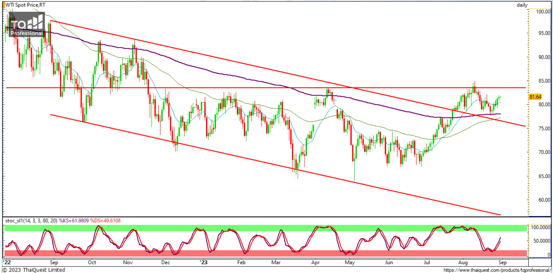
CHART INSIGHT Commodity Market