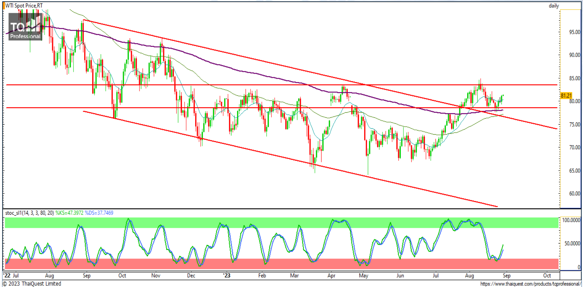
CHART INSIGHT Commodity Market