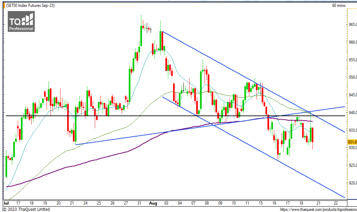
CHART INSIGHT SET50 Index Futures