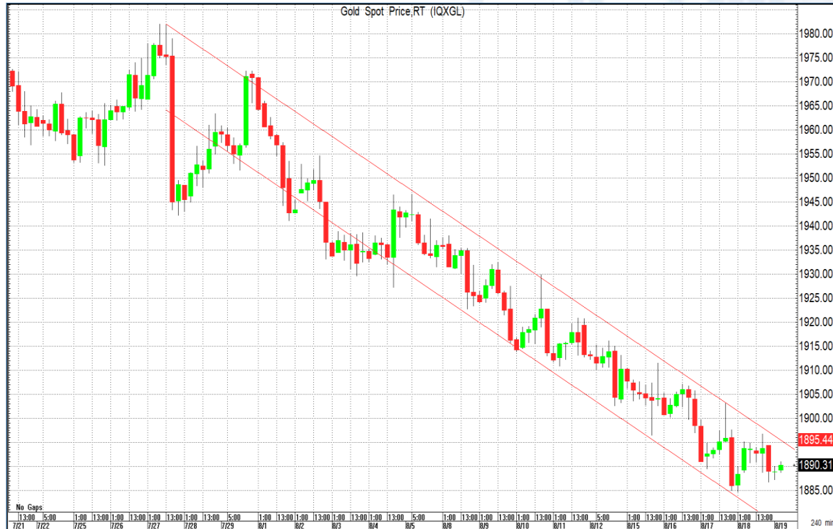
CHART INSIGHT Gold Futures