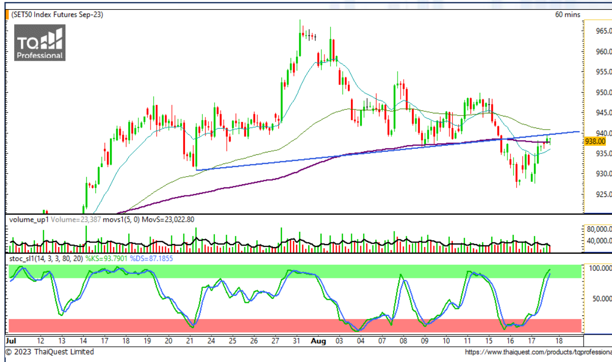
CHART INSIGHT SET50 Index Futures