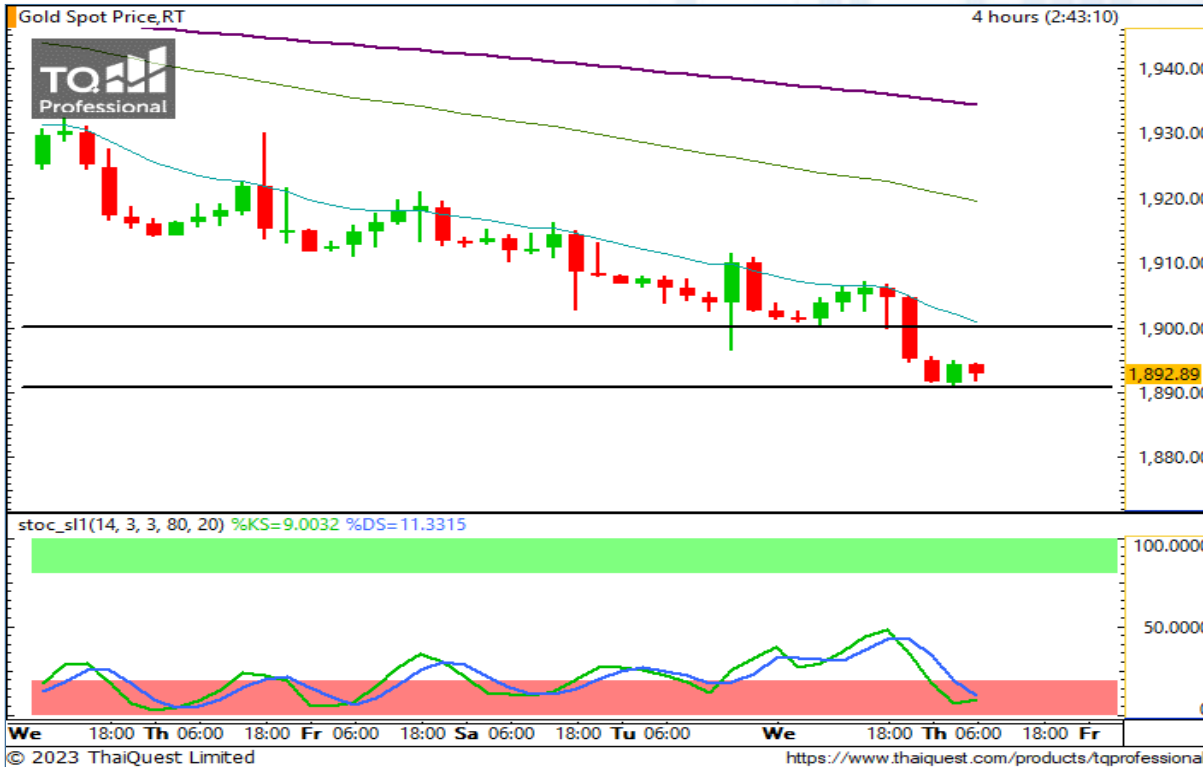
CHART INSIGHT | Gold Futures