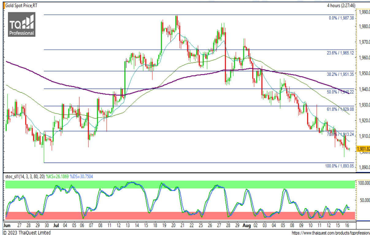
CHART INSIGHT | Gold Futures