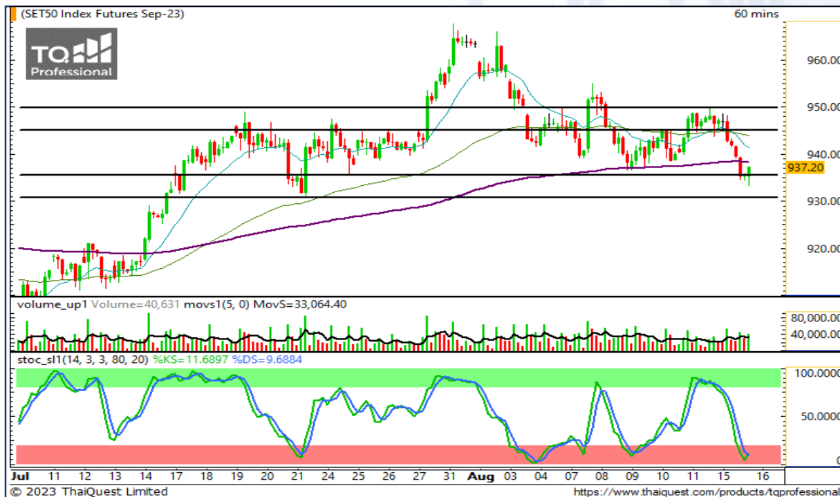
CHART INSIGHT SET50 Index Futures