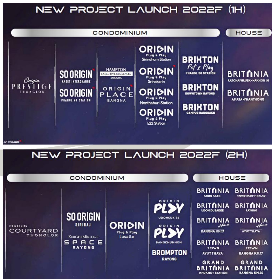
Figure 1: New Launches Plan in Y2022