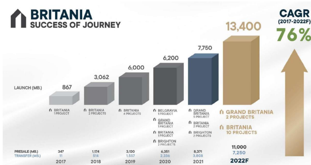
Figure 1: Target in Y2022