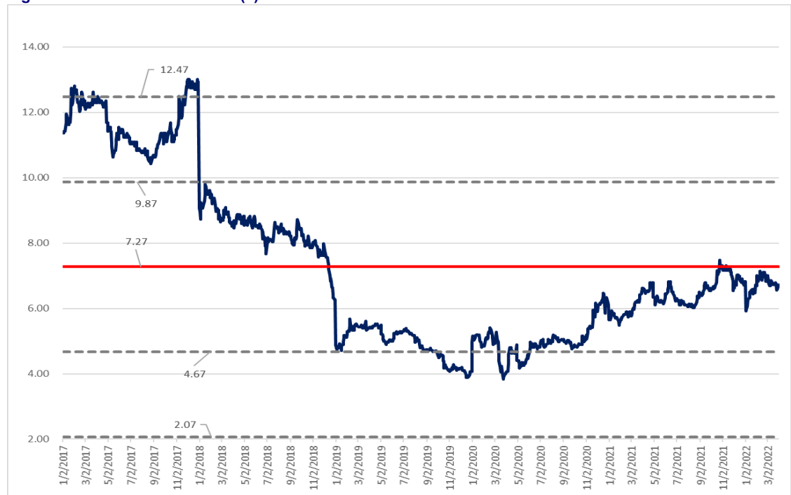
Figure 4: SC 5 Years P/E Band (x)