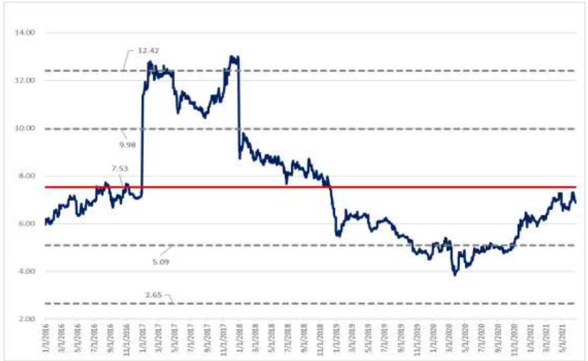
Figure 4: SC 5 Years P/E Band (x)