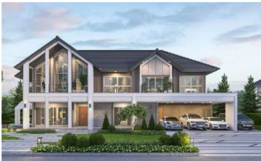
Figure 3: Bangkok Boulevard Signature Phetkasem - Pinklao