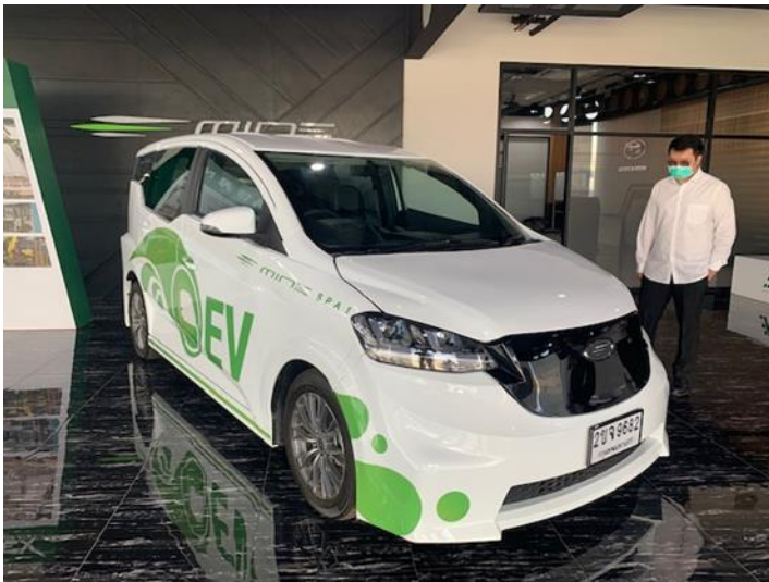
Exhibit 3: EV passenger car to be adapted to logistics carrier