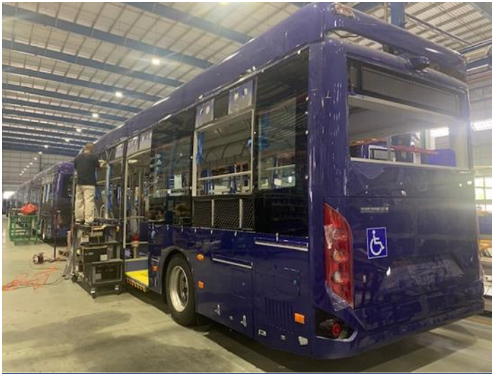
Exhibit 1: E-bus during the manufacturing process