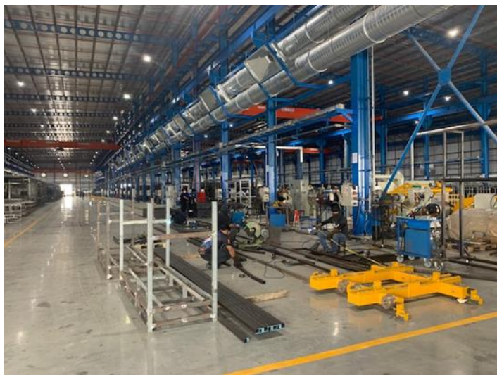
Exhibit 5: Welders working on the production line