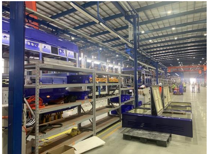
Exhibit 4: EV assembly line