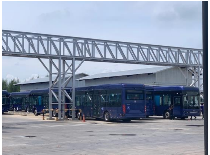
Exhibit 2: Finished e-buses waiting to be delivered