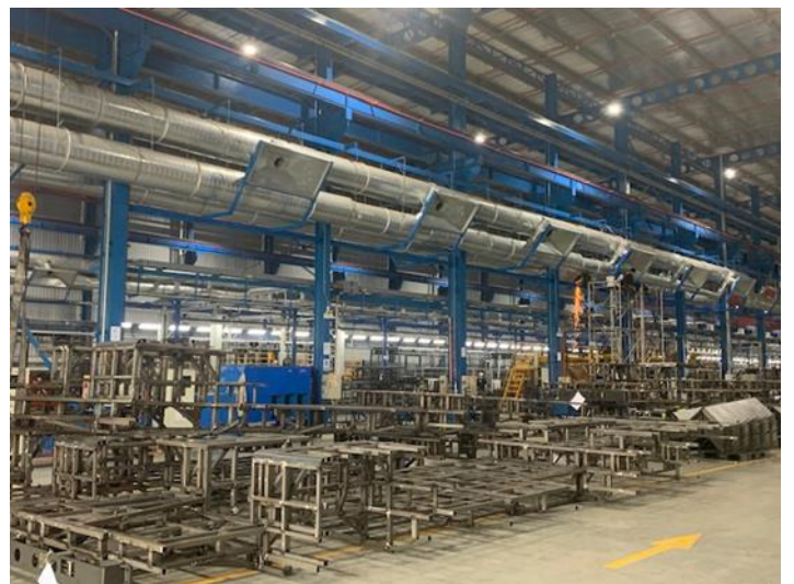
Exhibit 6: Painting and welding line