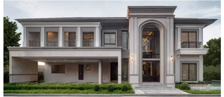
Figure 2: Grand Bangkok Boulevard Bangna-Onnut