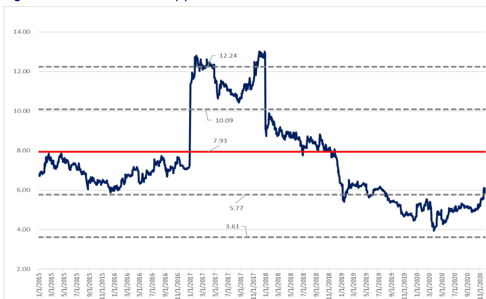
Figure 4: SC 5 Years P/E Band (x)