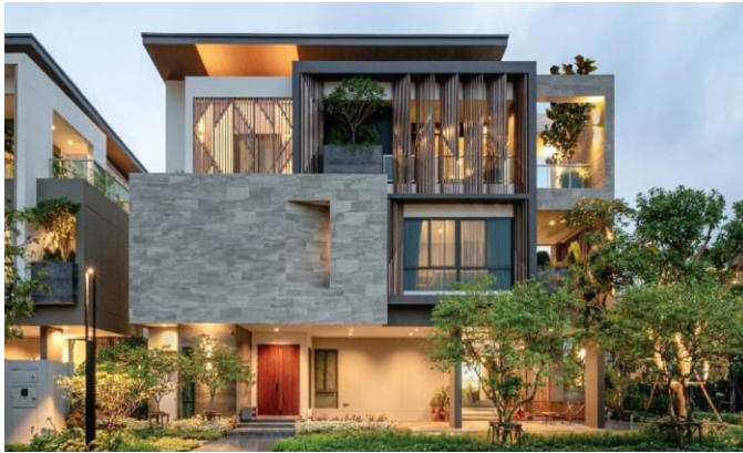
Figure 1: Gentry Phatthanakan