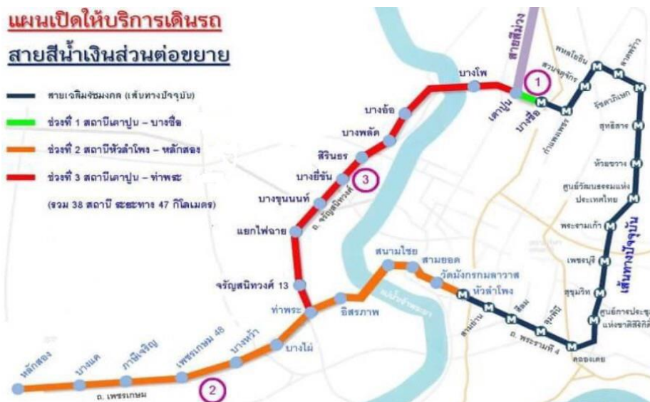
Figure 3: Blue Line Extension